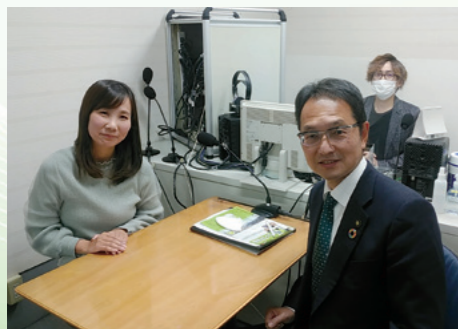
■レディオモモ(岡山シティエフエム)収録 [令和3年11月26日]