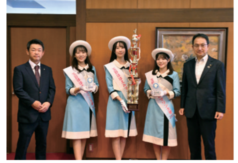
■ほほえみマリン大使を委嘱 [令和4年8月29日]