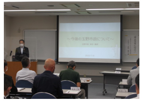
■たまの未来塾で講演 [令和4年7月8日]