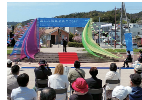
■瀬戸内国際芸術祭2022宇野港会場開会式典 [令和4年4月16日]