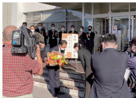
■市役所へ初登庁 [令和3年10月29日]