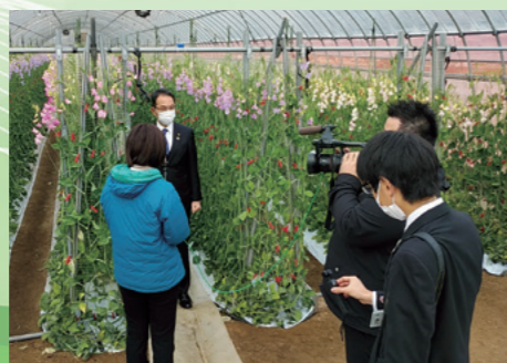
■RSK笑味ちゃん天気予報取材 [令和4年1月24日]