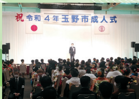
■成人式(ダイヤモンド瀬戸内マリンホテル) [令和4年1月9日]