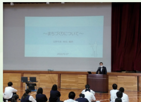
■玉野商工高校で特別授業 [令和4年5月27日]