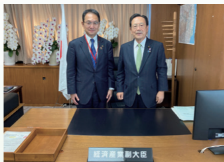
■国会議員、国の省庁へ挨拶 [令和3年11月18日]