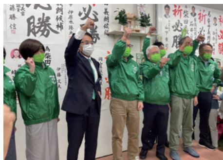
■初当選 16,362票を獲得 [令和3年10月17日]