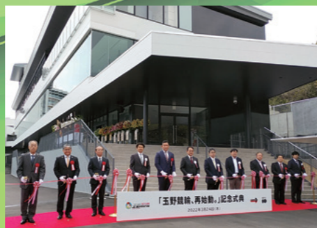
■「玉野競輪、再始動。」記念式典 [令和4年3月24日]