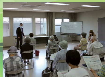
■荘内地区まちかどトーク [令和4年6月17日]