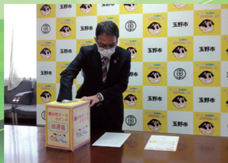
■健康たま〜るポイント抽選会 [令和4年3月9日]