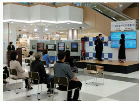
■まちぼす表彰式 [令和4年5月8日]