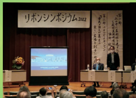
■市民会館を考えるリボンシンポジウム [令和4年7月2日]