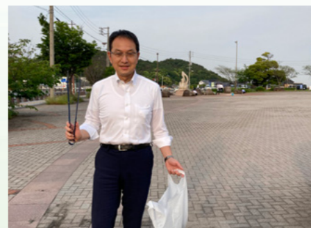
■宇野駅前クリーン作戦 [令和4年5月19日]