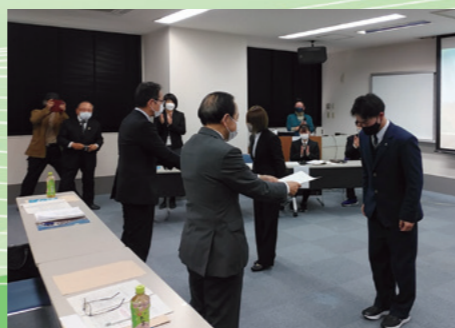
■高校生から市長への提言発表 [令和4年2月12日]