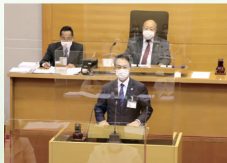
■市議会に初登壇 [令和3年12月3日]