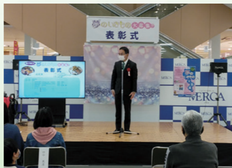
■夢のいきもの表彰式 [令和3年12月5日]