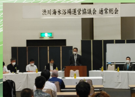
■渋川海水浴場開設決定 [令和4年6月6日]