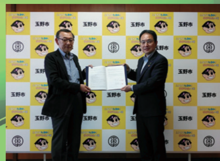
■三井生協と包括連携協定締結 [令和4年7月7日]