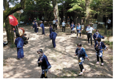
■常山女軍供養祭に参加 [令和4年8月12日]