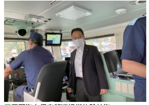
■玉野海上保安部巡視艇体験航海 [令和4年7月16日]