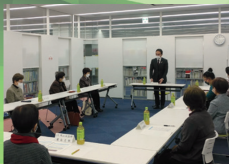
■女性団体連絡協議会出前トーク [令和4年2月18日]