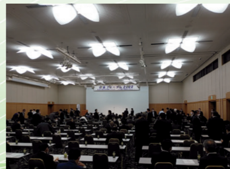
■市長フォーラム(東京・全国都市会館) [令和4年5月31日]